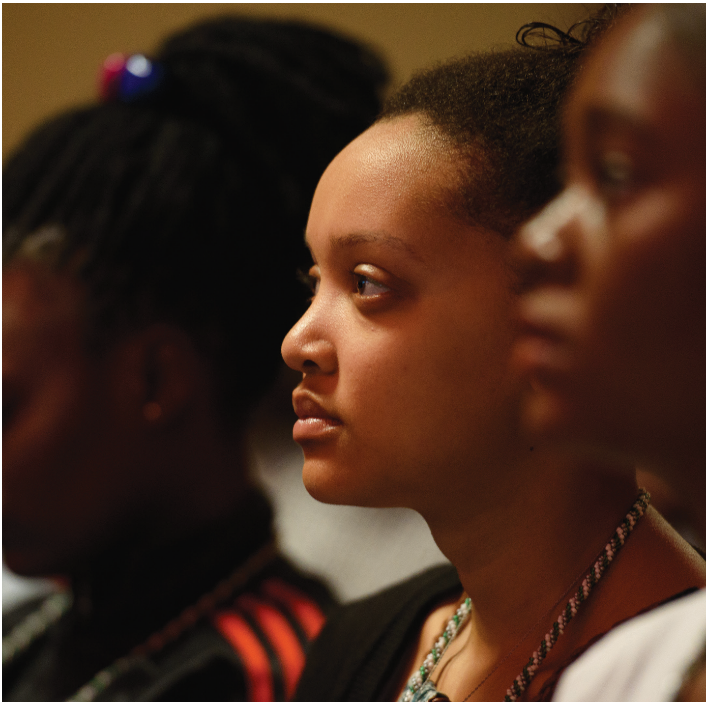
BOURSIERS DE LA FONDATION MASTERCARD AU SOMMET BAOBAB 2018 A KIGALI, RWANDA.

Si vous subissez de la violence ou de l'exploitation sous une forme ou une autre, soit physique, sexuelle ou émotionnelle, durant vos études à titre de boursier, veuillez en parler à une personne en qui vous avez confiance pour obtenir de l'aide. L'administrateur du programme est toujours disponible pour vous aider, si vous avez des inquiétudes de cette nature.